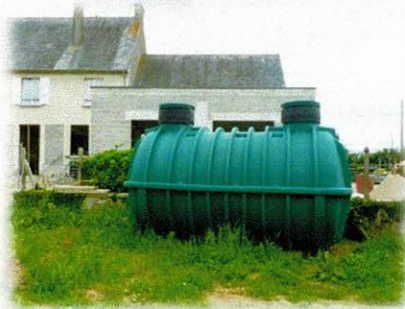
La fosse toutes eaux avant sa pose