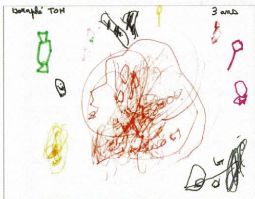
Tom DORAPHÉ, 3 ans

Belle surprise, puisque 18 enfants ont participé avec beaucoup d'imagination et respectant bien le thème, et quel dilemme pour choisir les lauréats, tant nous avons des talents dans la commune.