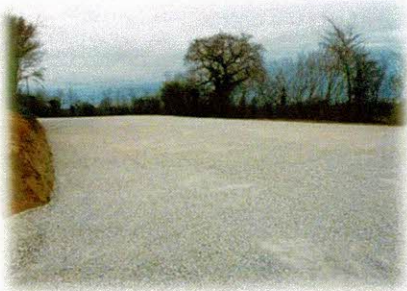
Le parking fini

Pendant ce temps, il y a eu également la création du parking et la pose de la fosse toutes eaux et de l'épandage. Le maître d'œuvre prévoit la fin des travaux de la salle communale pour le mois de mars 2018.