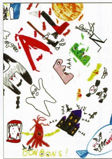
Hugo LEFRANÇOIS, 10 ans

Les gagnants des différentes catégories ont reçu un bon d'achat de 20 € à valoir au Bazar de Montebourg. Chaque participant a été récompensé.