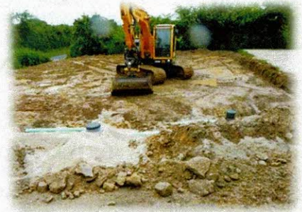
Emplacement de l'épandage